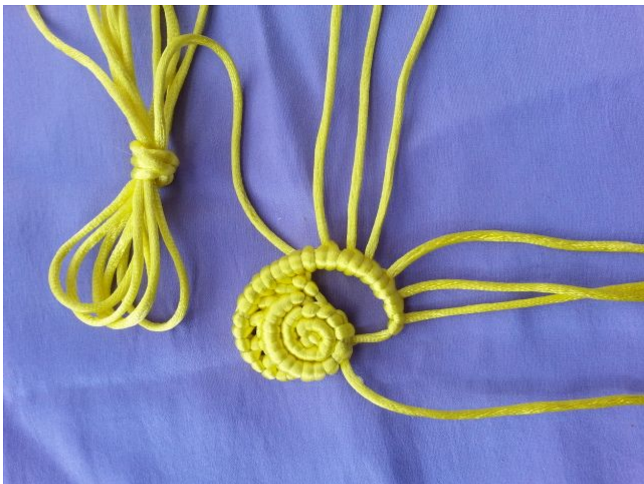
图 14: 再编斜卷结轴线依次递减至 1 根, 最后一根轴线穿过圆周上一点