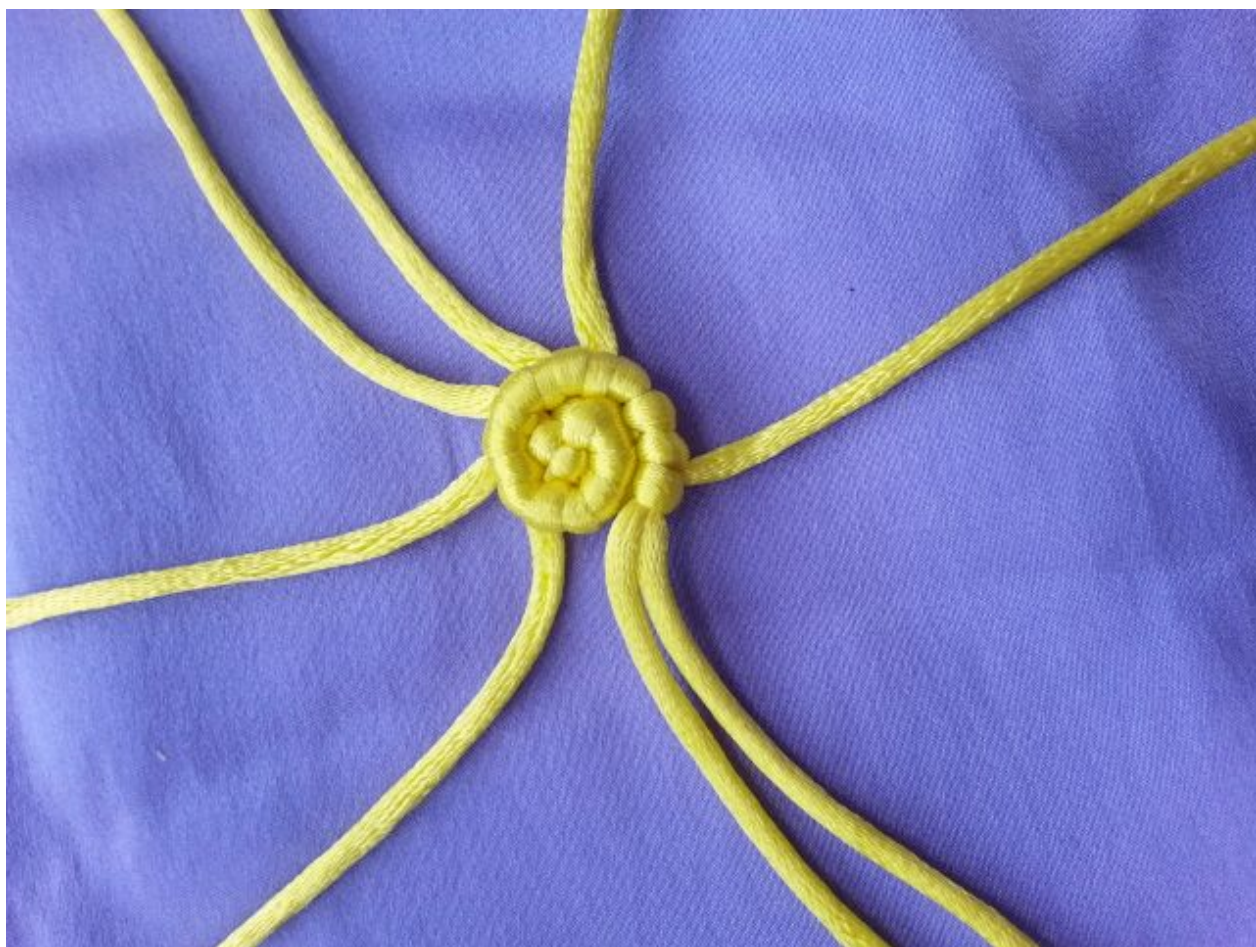
图 4：将上图的编线和轴线合并作轴再编斜卷结（两根轴线）