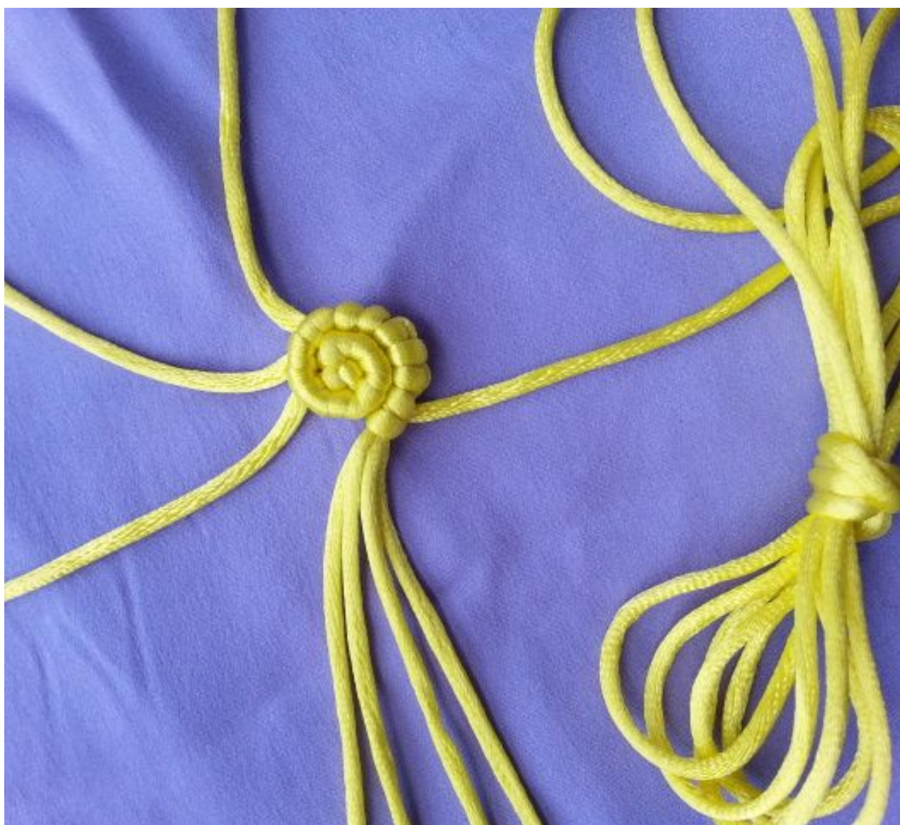
图 6: 同上，到这一步轴线有 4 根了（卷起的这根线就是 2 米线）