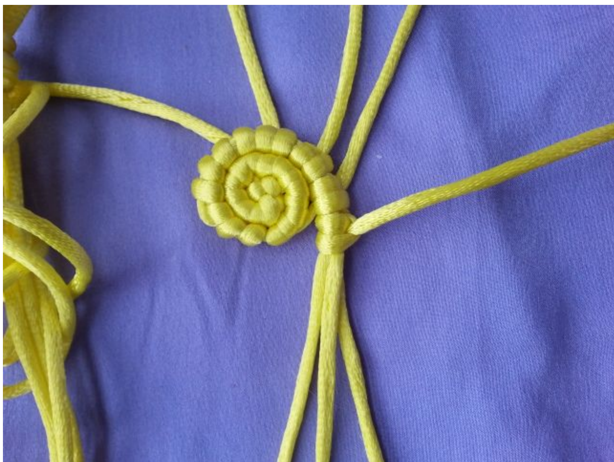
图 8: 接下来从 4 根轴线中取 1 根编斜卷结, 轴线递减至 3 根