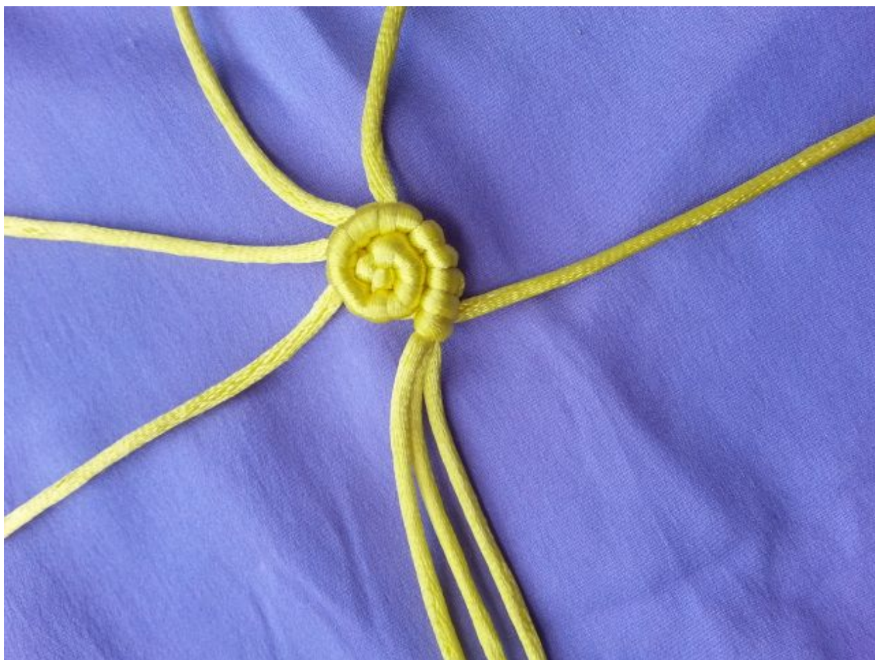
图 5: 重复图 4 的编法 (三根轴线)