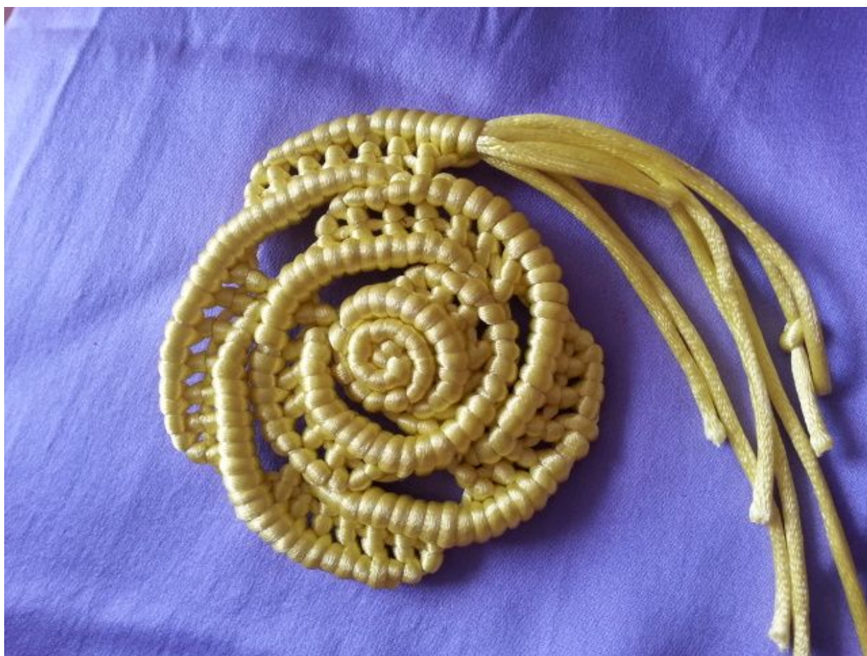
图 16: 玫瑰花朵部分完成