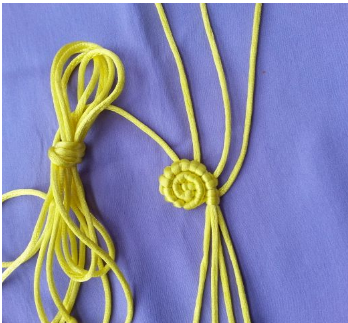
图 7：以 4 根线为轴将其余的 3 根线编完（最上面是 2 米线）