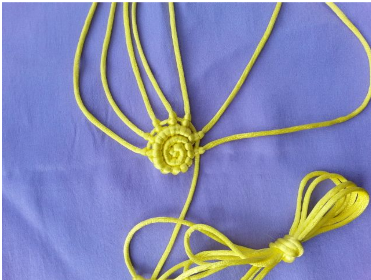
图 12：用 2 米线在其余 7 根线上编斜卷结