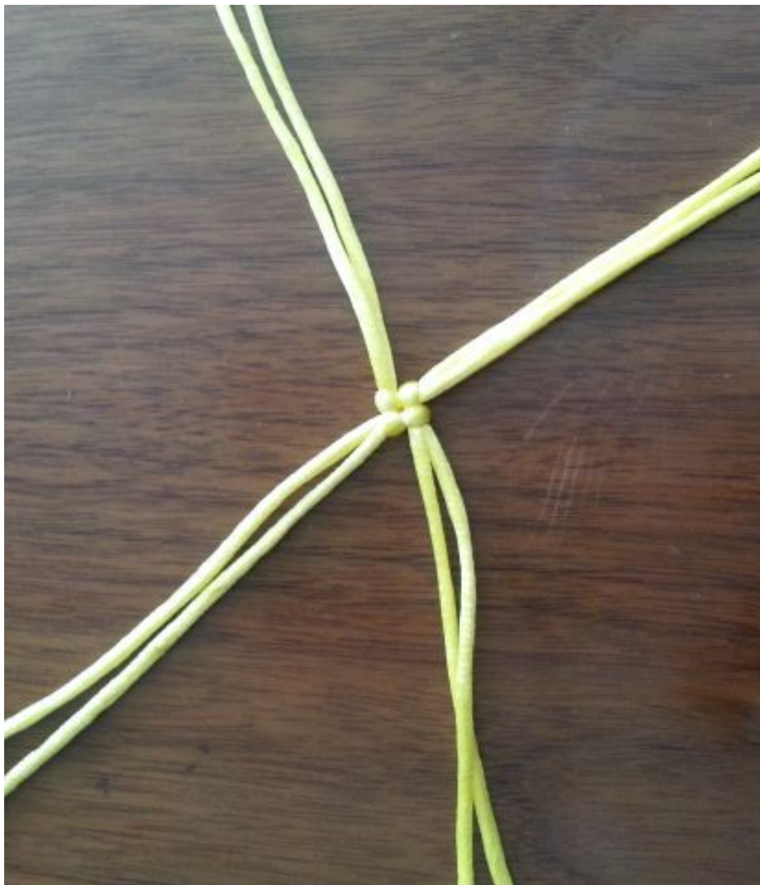
图 1：2 米线对折、3 米线从 1 米处折（一边 1 米一边）如图套在一起，形成 7 根 1 米线一根 2 米线。