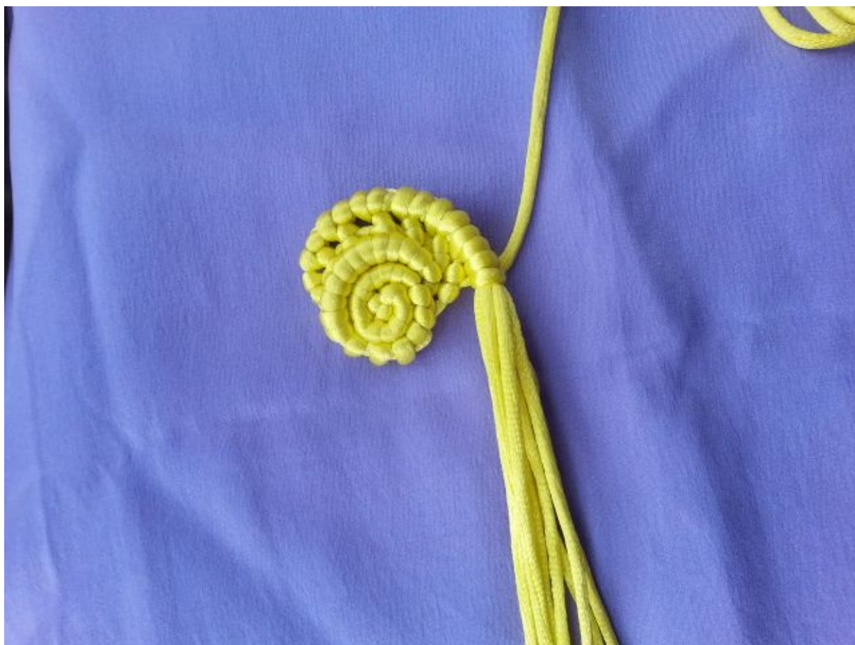
图 13：再依次编斜卷结，每编一次轴线增加 1 根，最后轴线递增至 7 根（除 2 米线外其余都是轴线）