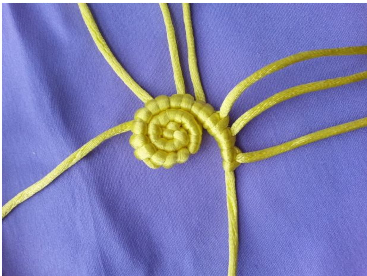
图 10: 同上 轴线递减为 1 根