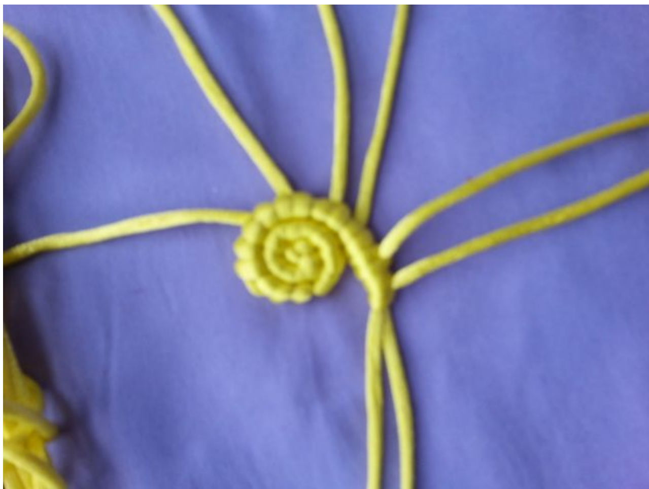
图 9：同上 轴线递减为 2 根