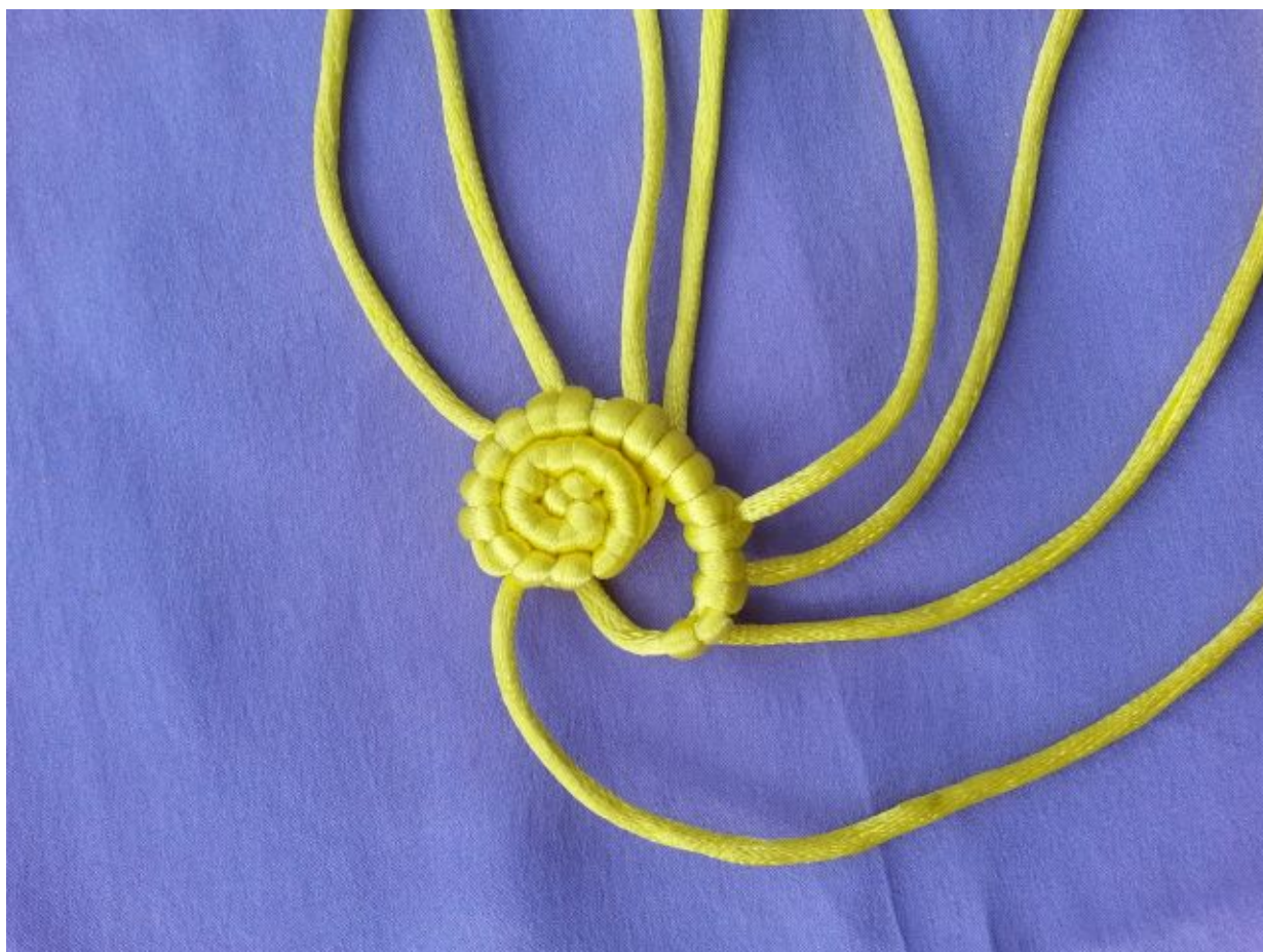
图 11：将最后一根轴线穿过圆周上一点，位置自定，只要线收紧后留一点缝隙即可。