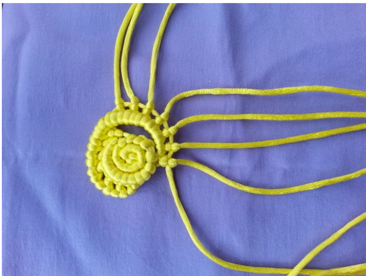
图 15：下面就重复图 12-14，直至线编完